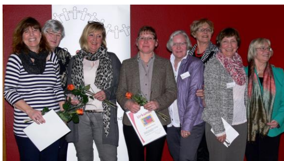
Ehemalige sowie aktive Stationsmütter des ELTERN TREFF