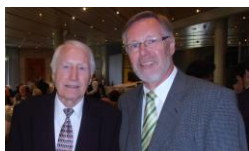
Fußball-Legende Hans Tilkowski seit 1987 Förderer unserer Arbeit