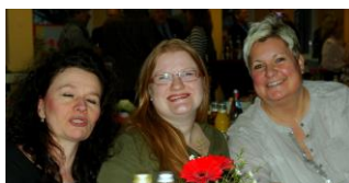
Schwestern der Kinder-Onkologie