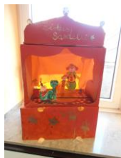
Dekoration des Saales mit Kinder-Kunstwerken durch Katja Schultz