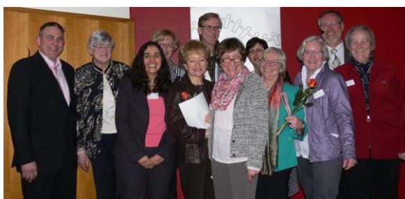
Ehemalige sowie aktive Vorstandsmitglieder/innen